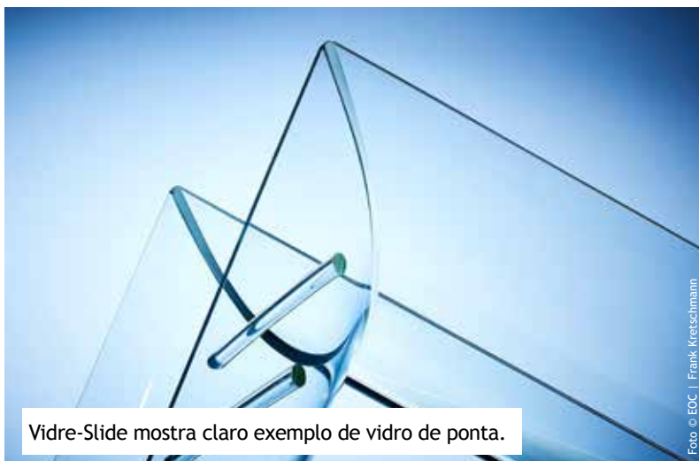
Vidre-Slide mostra claro exemplo de vidro de ponta.

“Tanto a Sedak como a North Glass investiram nessas ideias com muita pouca visibilidade de um futuro interesse. Foi um ato de pioneirismo da parte deles, e eles foram corajosos de dar esse passo. Como previmos,