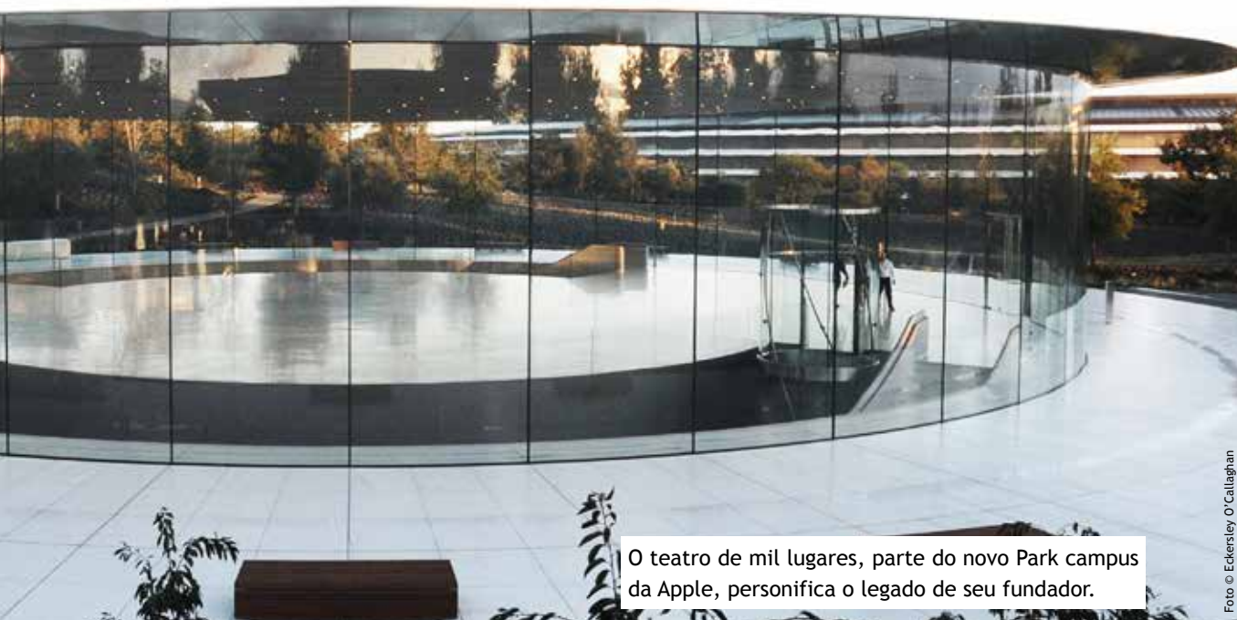
O teatro de mil lugares, parte do novo Park campus da Apple, personifica o legado de seu fundador.

“Os códigos são importantíssimos também”, adicionou. “Quinze ou vinte anos atrás havia pouquíssimos códigos globais para vidro. Agora eles estão mais estabelecidos e com isso vem a capacidade de usar o vidro numa natureza estrutural onde existe esse âmbito de códigos. No entanto, temos que continuar criativos, e não apenas seguir instruções. Os criadores dos códigos precisam ser cuidadosos para evitar que eles se tornem prescritivos demais – isso pode ser pior do que não termos código algum.”